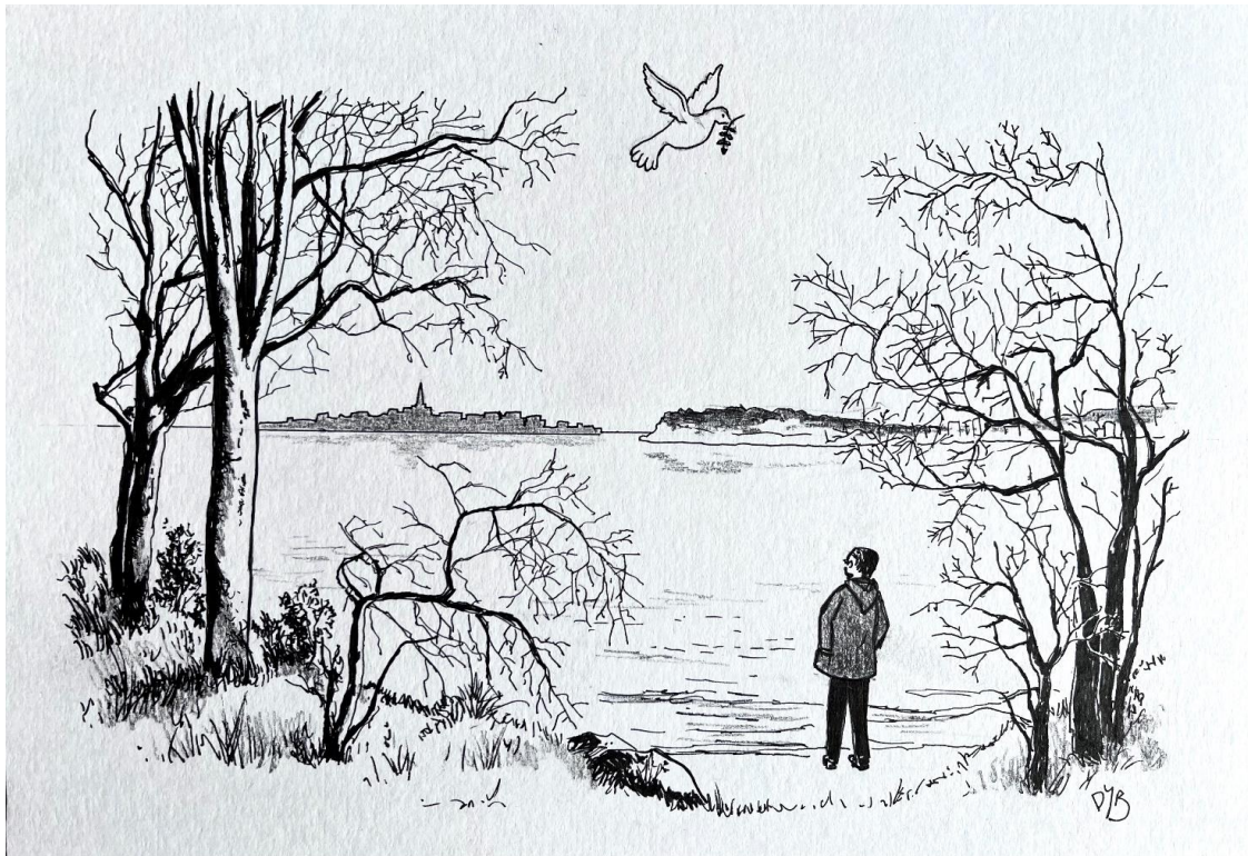
Dessin Pierre-Yves Burgaud